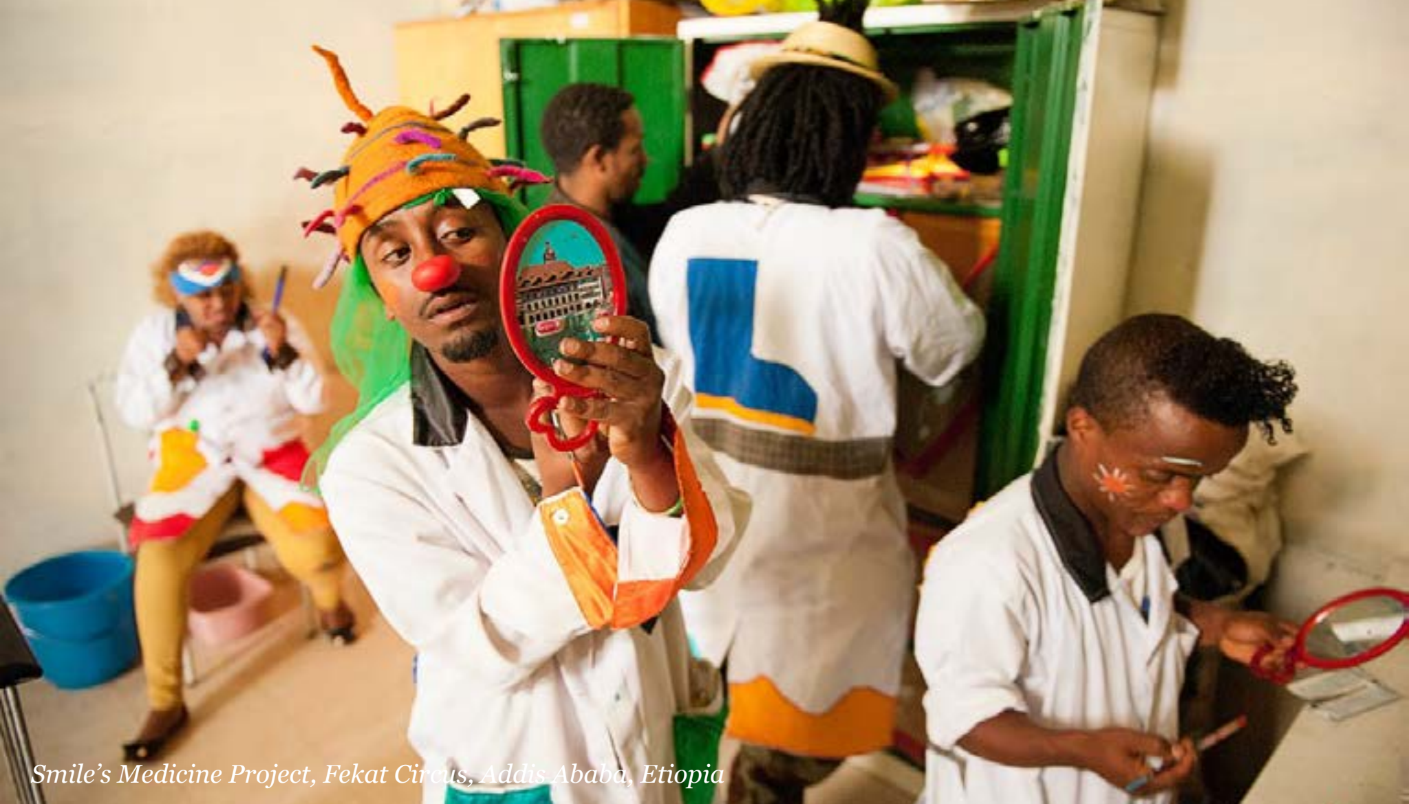
Smile's Medicine Project, Fekat Circus, Addis Ababa, Etiopia