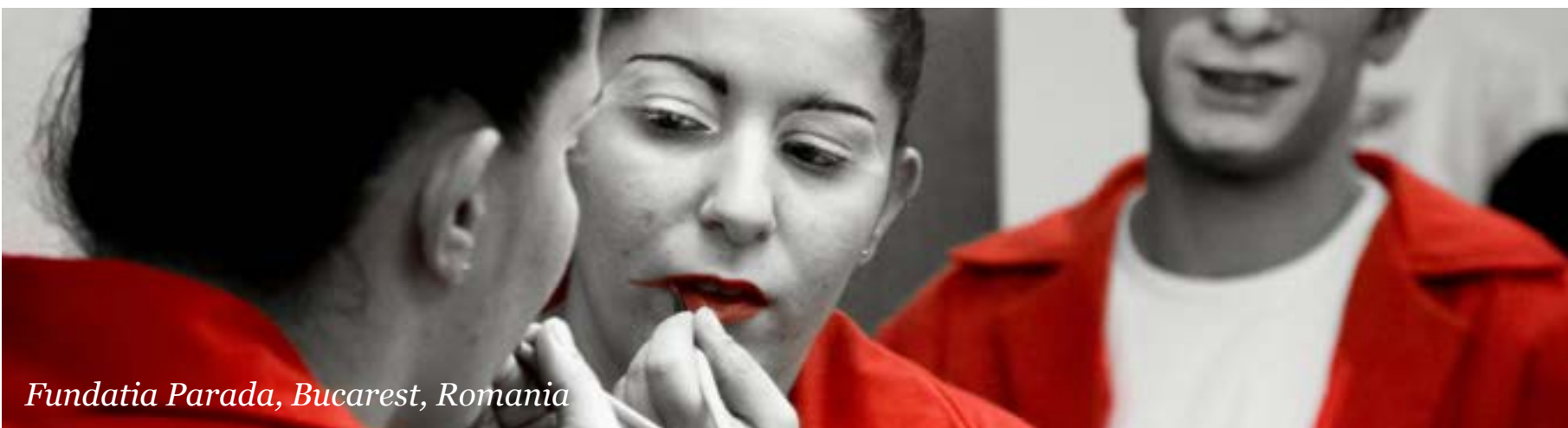
Fundatia Parada, Bucarest, Romania

Il progetto sostenuto dalla Fondazione a partire dal 2013, è proseguito anche nel 2014. Realizzato in partnership da VSO UK, VSO Jitolee e ANDY- Action Network for Disabled,